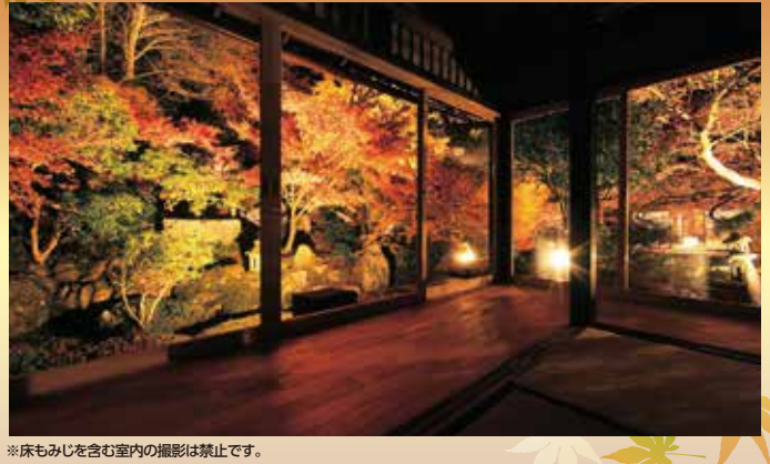
※床もみじを含む室内の撮影は禁止です。