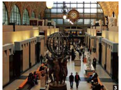
1 バチカン宮殿内のシステリーナ礼拝堂には、ミケランジェロによって描かれた「アダム」などルネサンスを代表する絵画が天井画として描かれている 2 ルーヴル美術館のドゥノン翼2階に展示されている、ルネサンス三大巨匠の一人ラファエロの「聖母子と幼き洗礼者聖ヨハネ」 3 オルセー美術館はパリにある19世紀美術専門の美術館。印象派の作品を多く収蔵していることで知られている

詳しい旅行条件と内容を説明した書面をお渡します。事前にご確認のうえ、お申し込みください。 ※写真はすべてイメージです。